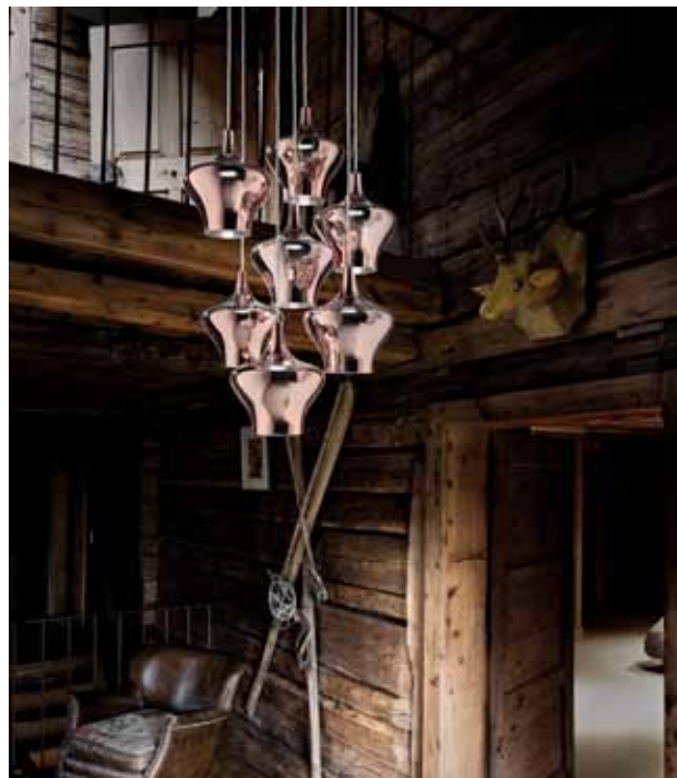
Studio Italia Nostalgia