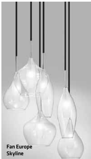
Fan Europe Skyline