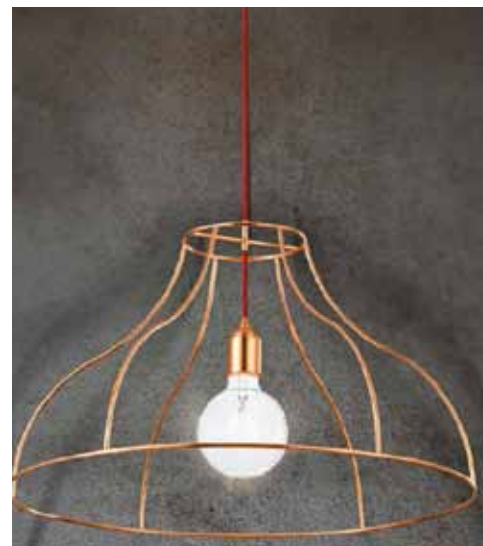
Fan Europe Frida