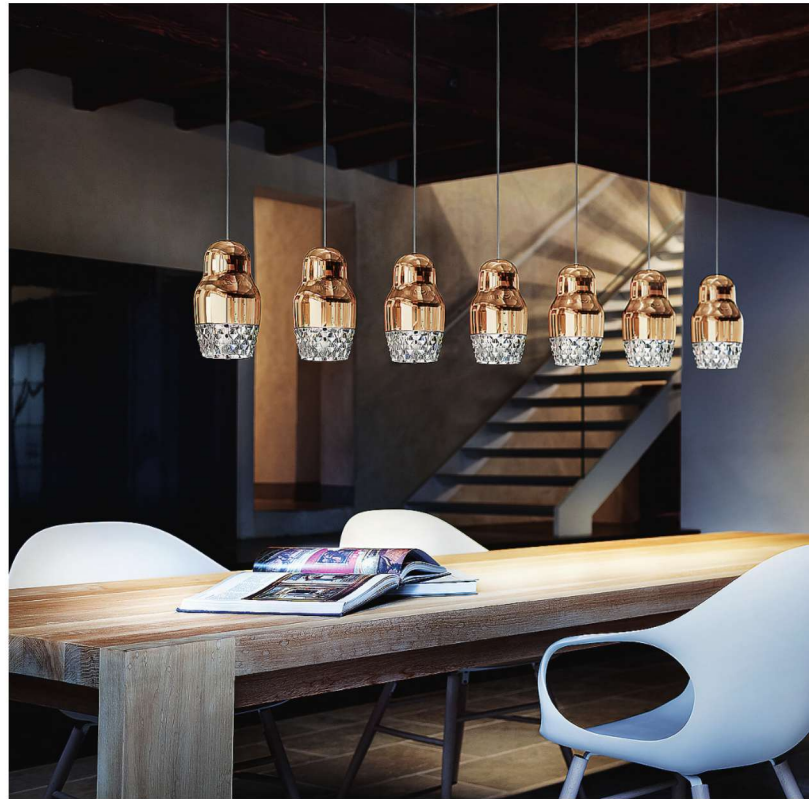
↑ Alumiiniumist ja klaasist Fedora lambid on inspireeritud vene nuku matroška vormist.