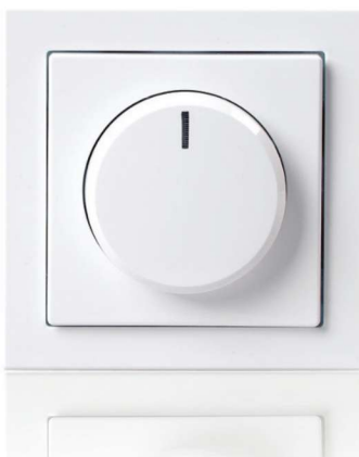
ABB tootevalikusse on lisandunud spetsiaalsed LED-valgustite valgusregulaatorid, mis on välja töötatud koostöös Philipsiga. Saadaval on nii klassikaline pööratav regulaator kahejuhtmeliseks ühenduseks (ei vaja neutraali) kui ka surunupuga regulaator kolmejuhtmeliseks (neutraaliga) ühenduseks. ABB LED-valgustite regulaatorid on mõeldud reguleerima 2-200 VA koormust ja sobivad enamikesse ABB lülitite-pistikupesade sarjadesse, sealhulgas Jussi, Impressivo, Basic 55 jt. www.installatsioonitarvikud.ee

ABB AS Aruküla tee 83 75301 Jüri, Rae vald, Harjumaa, Eesti Tel +372 5680 1800 contact.center@ee.abb.com