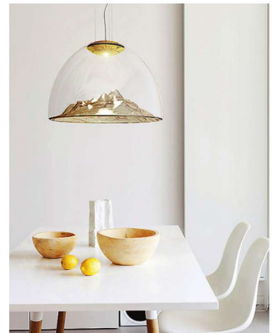
→ Mountain View valgusti toob minimalistliku jäämäe modernses vormis koju kätte.