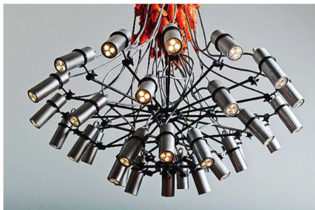
↑ Cranberry tool-valgusti sobib nii linnakasutusse kui ka siseruumidesse, Lightweight valgusti elemente saab aga vastavalt vajadusele uue nurga alla suunata.