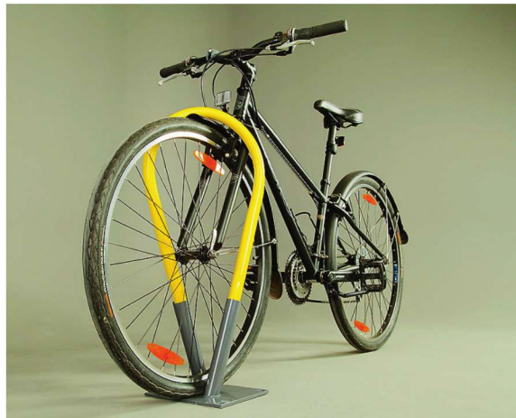
↑ Elastne ja aasa meenutava kujuga jalgrattahoidja võitis 2012. aastal Bruno disainiauhinna.