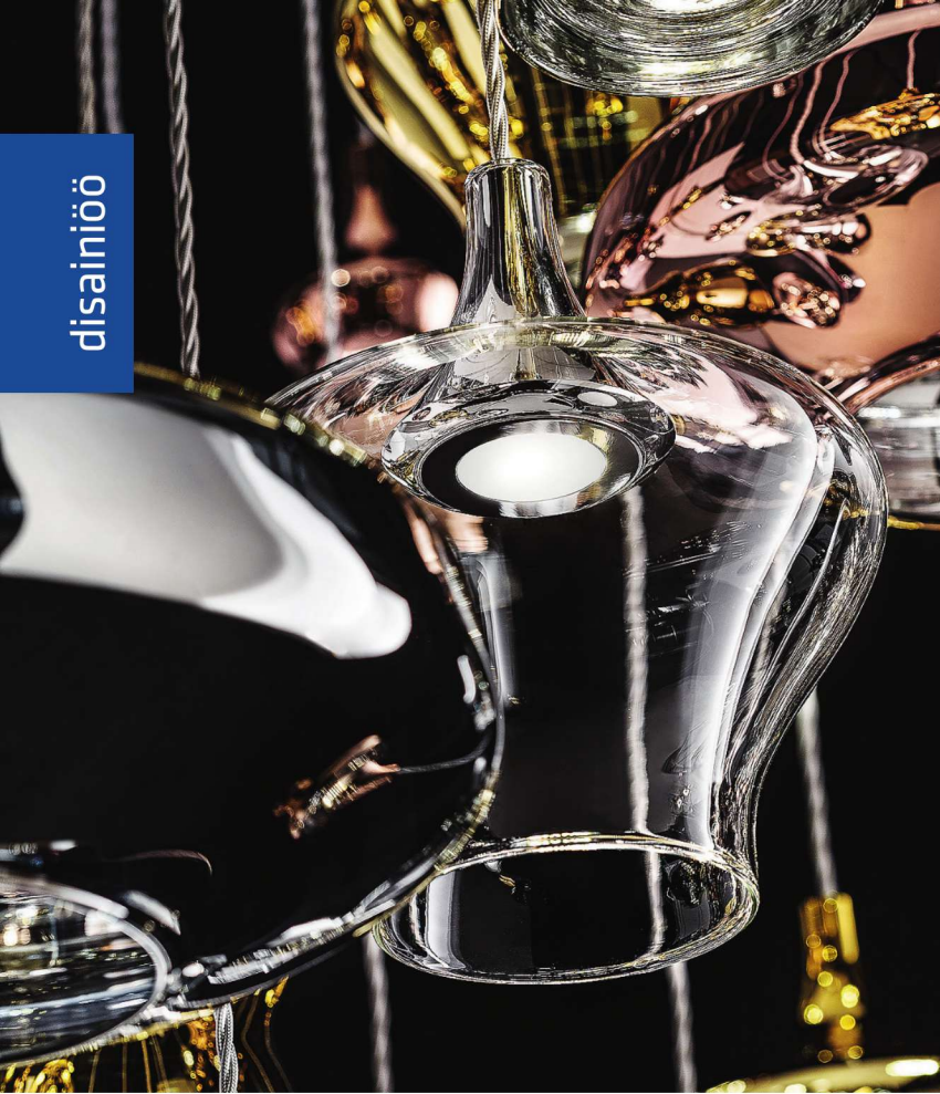
↑ Studio Italiale disainitud Nostalgia valgustites koonduvad retrovormid ja moodsad jooned. Puhutud klaasist ja saadaval eri värvides.