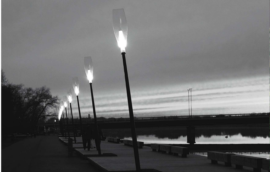
↑ Pärnu kesklinna jõekaldal valgustab teed aerusporditemaatiline valgustirida.