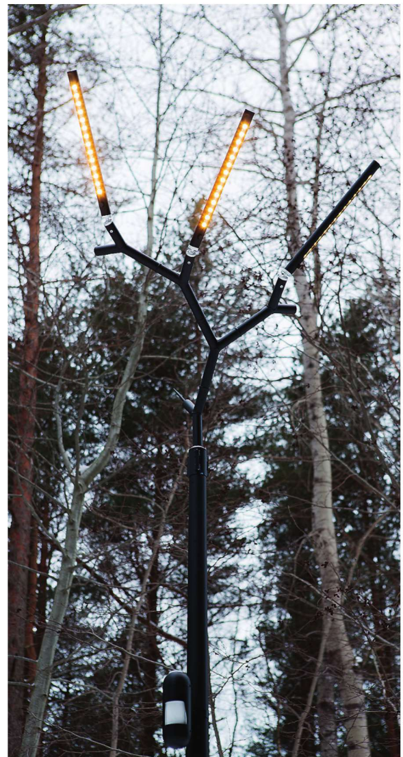
↑ Branch on kergliiklusteede ja hoovialade dünaamiline valgustikontseptsioon, mille erinevad kujud on inspireeritud puuvõradest ja taimeõisikutest.